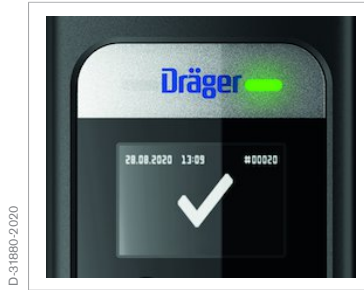
Símbolo "Alcohol detectado"