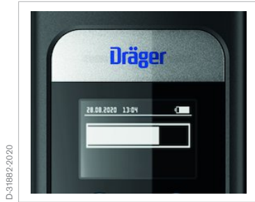
Símbolo "Prueba en curso"